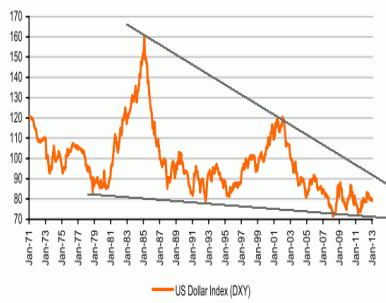
Chart 1: US Dollar Index (DXY)