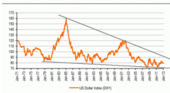
Chart 1: US Dollar Index (DXY)

Jede in sich instabile Situation muss irgendwann ihr Ende finden. Der Dollar-Index hat seit Ende des Bretton Woods Systems drei Abwärts- und zwei Aufwärtszyklen durchlaufen, die im Schnitt rund sieben Jahre anhielten. Der dritte Abwärts-Zyklus startete 2001 nach Platzen der Technologieblase und mit der Finanzialisierung der Rohstoffmärkte, er endete auf dem Höhepunkt der Finanzkrise. Das damals markierte Tief wurde, bedingt durch bedeutende Asset-Verlagerungen aus dem Dollar heraus, 2011 erneut getestet und hielt.